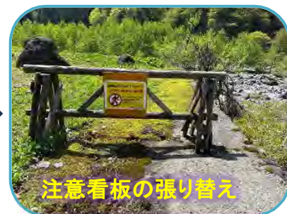
注意看板の張り替え