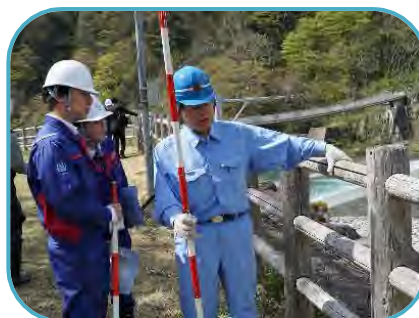
点検実施状況 (常願寺川水辺の楽校)