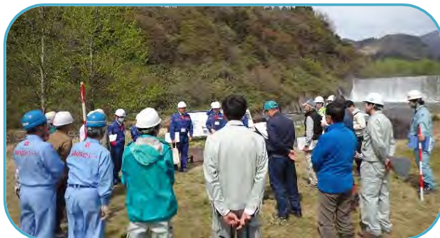
参加者29名での点検箇所・項目の確認 (常願寺川水辺の楽校)