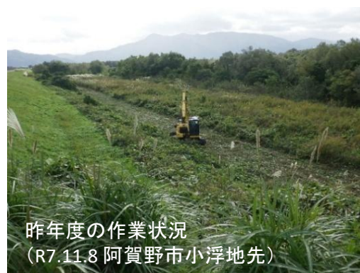
昨年度の作業状況 (R7.11.8 阿賀野市小浮地先)