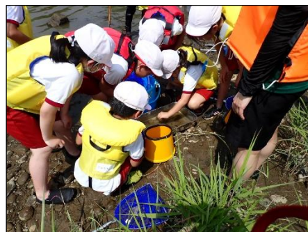
採集した水生生物を判定