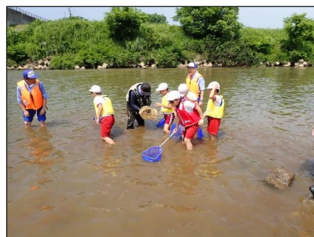
川にすむ生きものを採集

※ 順延・中止の場合、前日正午に決定し、高田河川国道事務所X(旧Twitter)でお知らせします。