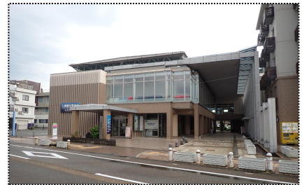
入善まちなか交流施設 うるおい館