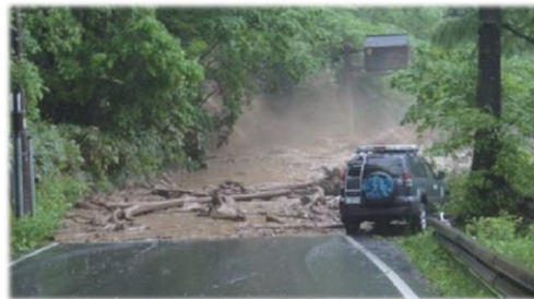
平成23年 上高地（産屋沢）の土石流