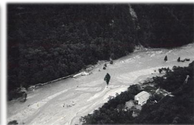
昭和44年 高瀬川災害の葛温泉付近