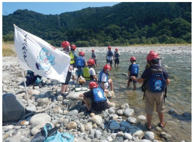
令和7年度 中流部調査