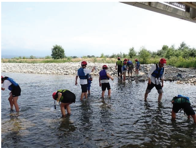
令和7年度 下流部調査