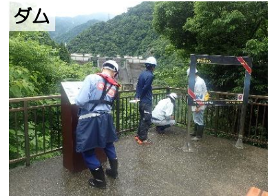
令和7年度の点検実施状況