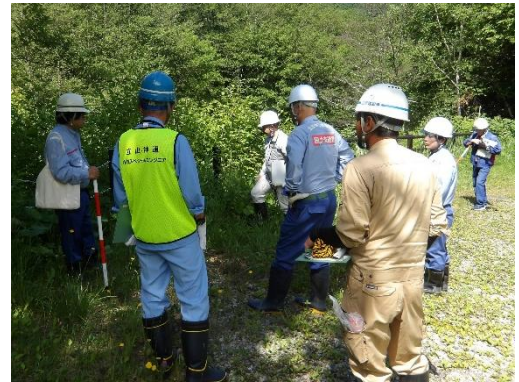
昨年度（夏休み前）点検の実施状況