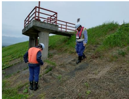
令和7年度の点検状況 （湯川村工業団地公園）