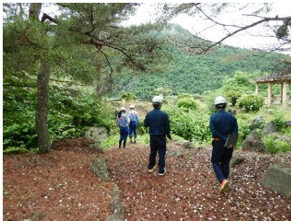
令和7年度の点検状況 （大川ダム管内若郷湖東公園）