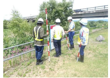
令和7年度の点検状況 （会津若松市大川南四合緑地）