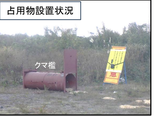
常願寺川(立山町)での設置状況