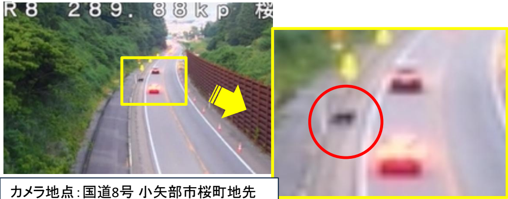
カメラ地点: 国道8号 小矢部市桜町地先 確認日時: 2024年6月上旬 19時頃

日常的な道路パトロール及び道路管理用カメラにおいて、クマを発見した場合は、関係機関に通報することで、市町村等が行うクマ出没に関する情報収集を支援します。