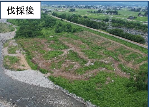
常願寺川右岸16.0k付近(立山町三ツ塚新) R8年6月18日撮影