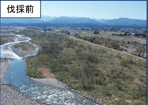
常願寺川右岸16.0k付近(立山町三ツ塚新) R8年4月撮影