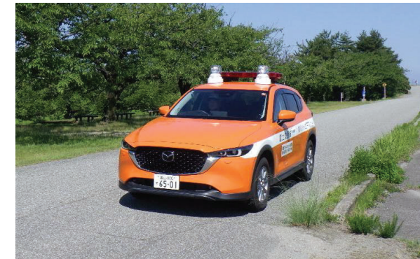
河川パトロールカー

黒部川の河川巡視を行う河川パトロールカーより、河川利用者に対して音声でクマ出没注意の呼びかけを行っています。