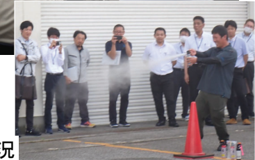
クマ対策講習会実施状況