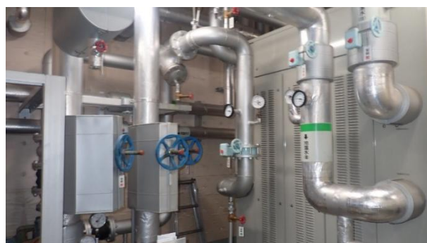
【既存吸収冷温水機廻り】