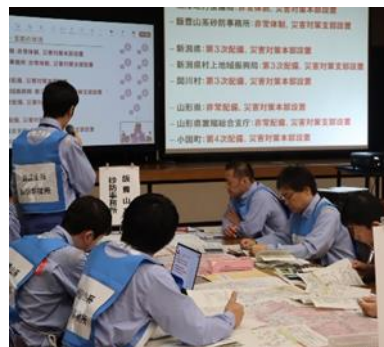
会場の様子（関川村民会館）