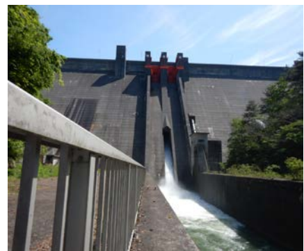
ダムからの放流時の様子