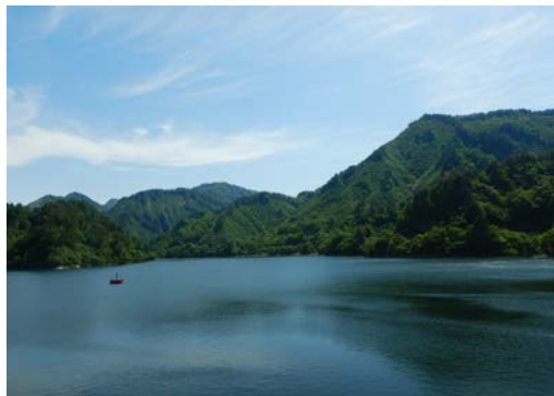
貯水位を下げる前の おおいし湖

これからの梅雨や台風シーズン等に備え、大雨により発生する洪水を貯め込む容量(洪水調節容量)を確保しておくため、5月28日から6月15日までの間で、ダム貯水池(おおいし湖)の水位を約25m低下させます。これにより、新潟県庁約94杯分(1,750万m 3 )の容量を確保します。