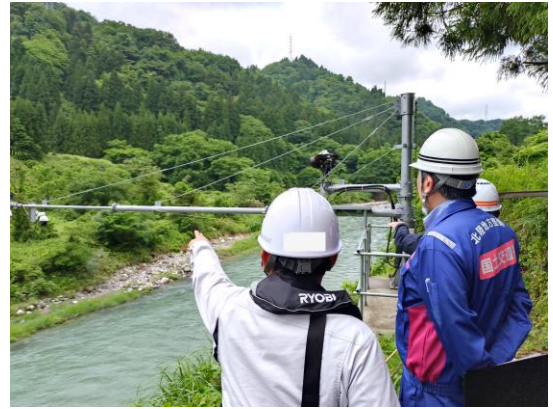
(参考)昨年度の点検実施状況