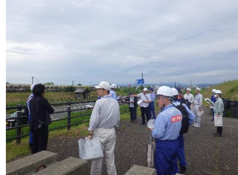
洪水時の水防活動について確認 【瑞雲橋】