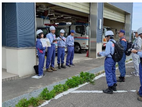
災害対策車両、水防活動用資材を確認 【三条MIZBEステーション】