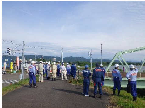
洪水時の水防活動について確認 【小須戸橋】