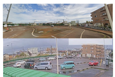
現状の西口駅前広場