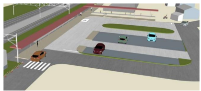
西口駅前広場イメージ