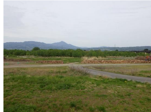
配布予定の伐採木