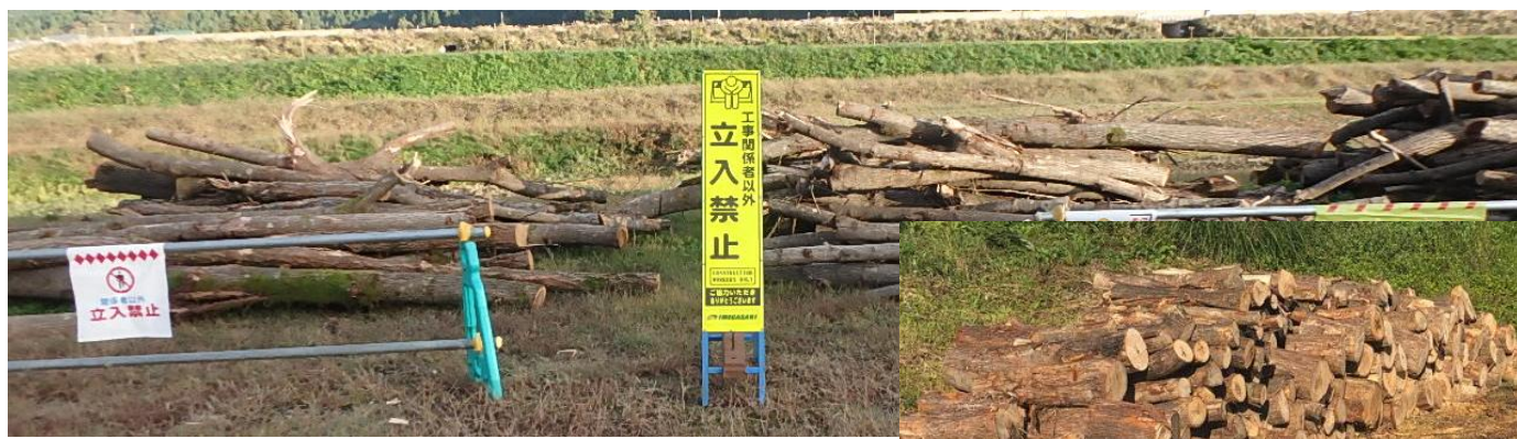
※写真は過去の状況