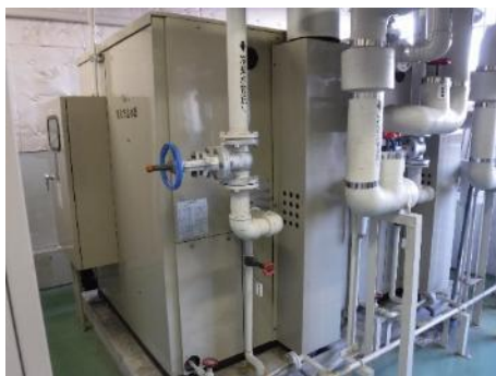
【既存吸収冷温水機】