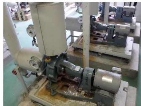
【既存空調用ポンプ】