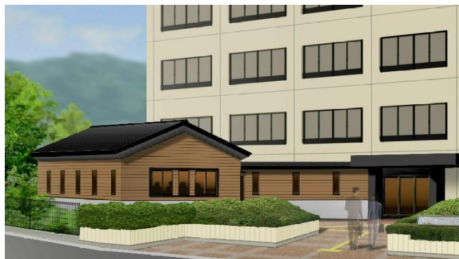
【増築庁舎イメージパース】