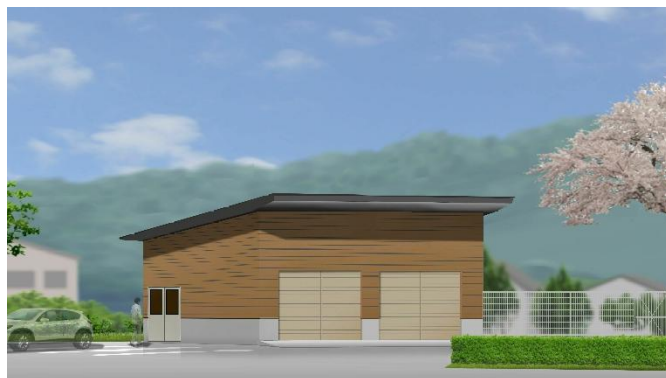
【車庫イメージパース】