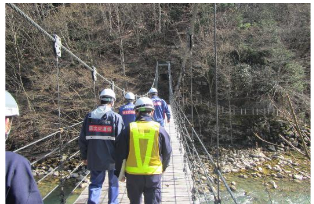
令和7年安全利用点検状況