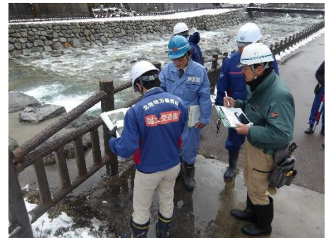
GW 前点検（前回）の実施状況