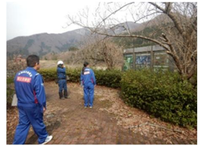
令和7年度の点検状況 （大川ダム管内大川ダム西公園）