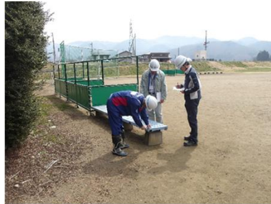
令和7年度の点検状況 （会津若松市大川緑地公園）