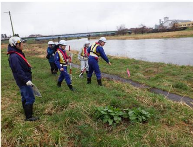
令和7年度の点検状況 （湯川村工業団地公園）