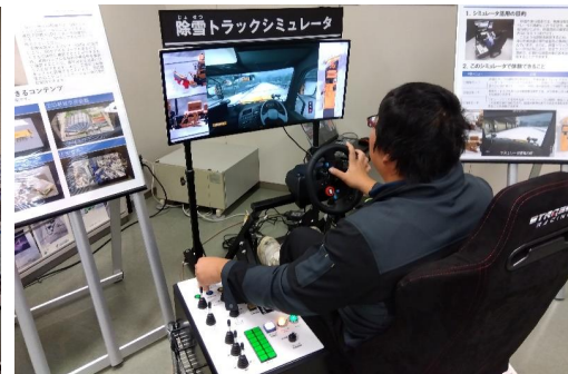
除雪トラックシミュレータ