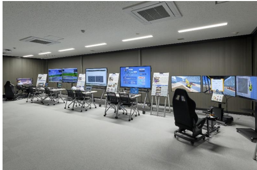
施設イメージ(新潟)

～体験内容～ 出張DXルーム in 富山 (R6.12.3～12.5 開催) の様子