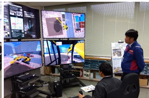
バックホウシミュレータ