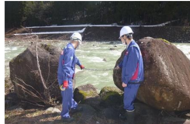
白峰砂防 白峰床固工