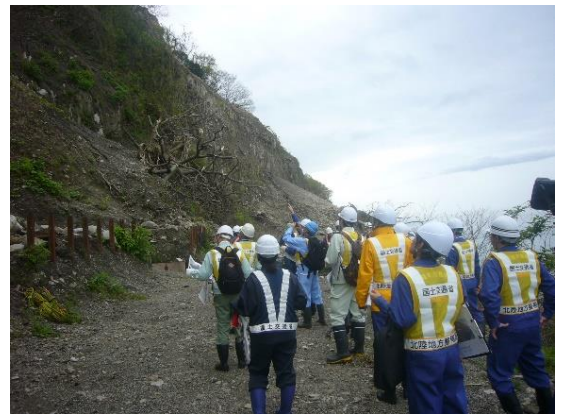
洞門上斜面の点検状況