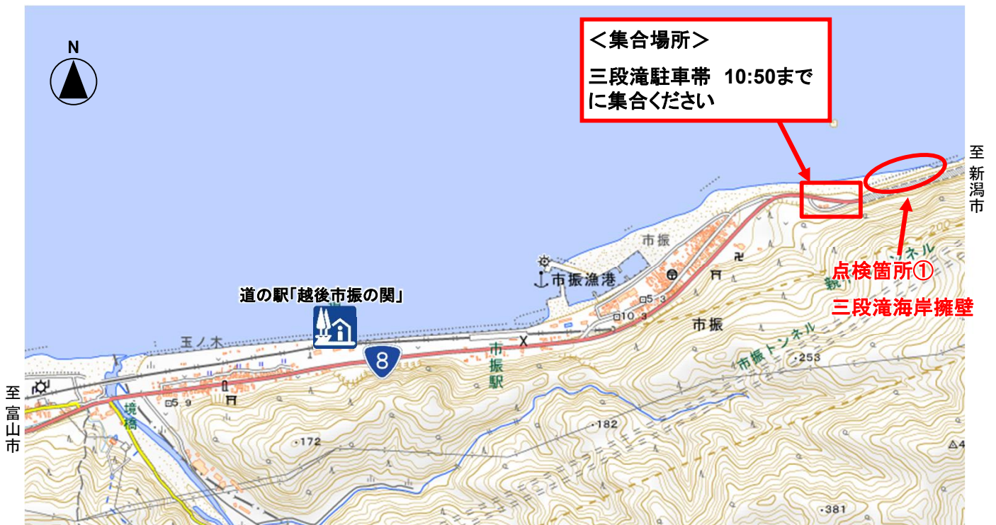
三段滝駐車帯付近 拡大図