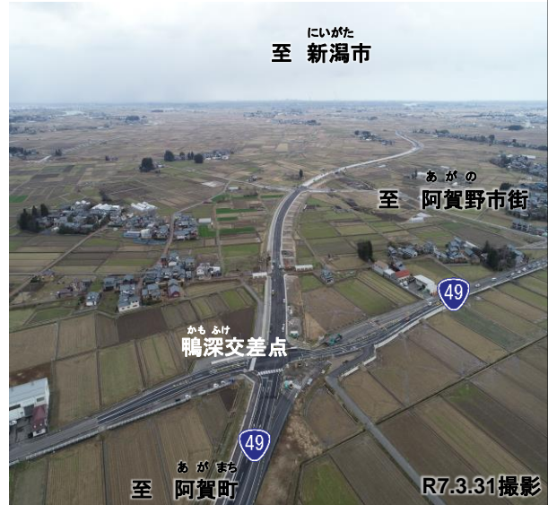
①整備状況(阿賀野市寺社から新潟市方面を望む)

区 間: (起)新潟県阿賀野市寺社 (終)新潟県阿賀野市下黒瀬 延 長: 8.1km (既開通区間 5.4km) (R7年内開通予定 2.7km)