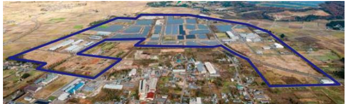
県営東部産業団地 (全景)