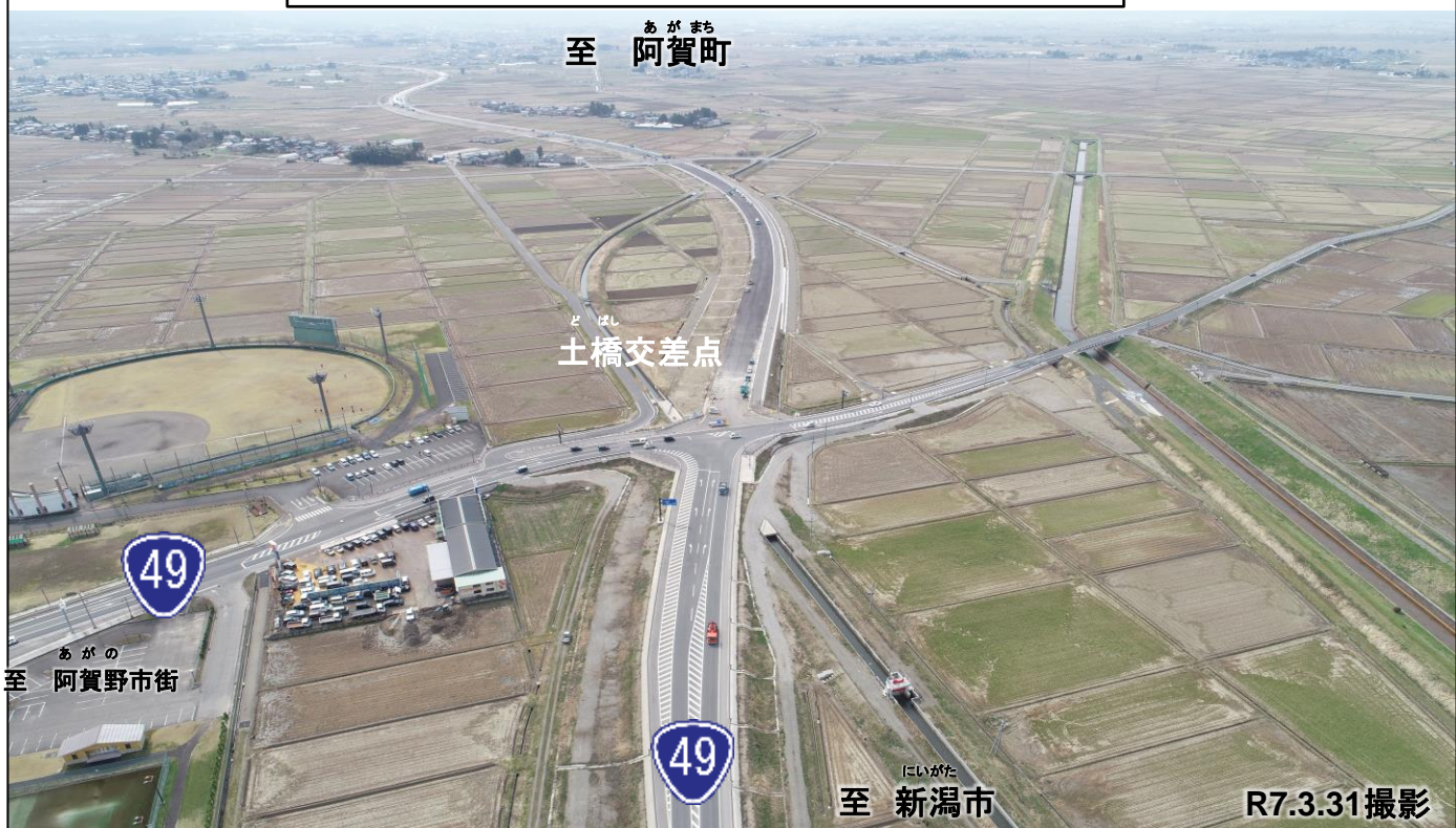
②整備状況(阿賀野市百津から阿賀町方面を望む)

(今回) R7年6月8日 暫定2車線全線開通予定 阿賀野市寺社～百津 (延長2.7km)