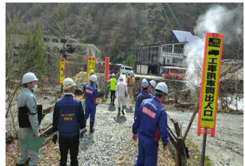
前回（GW前）点検の実施状況