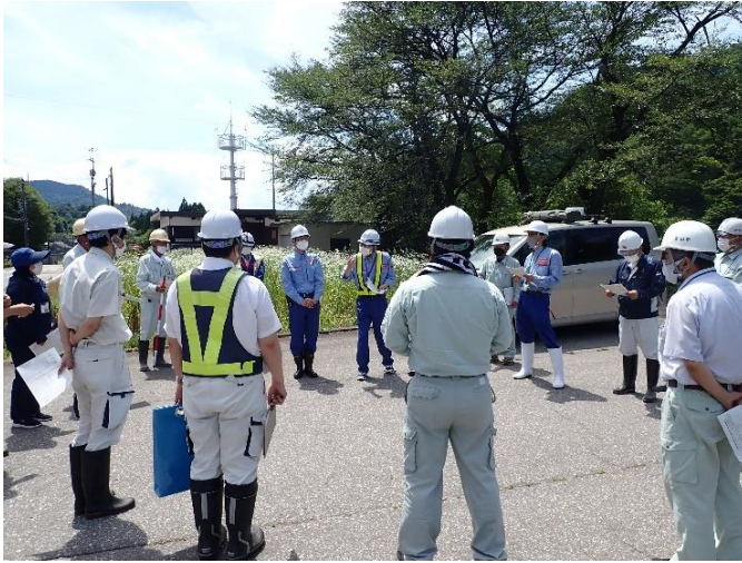
参加者19名での点検箇所・項目の確認 (常願寺川水辺の楽校)