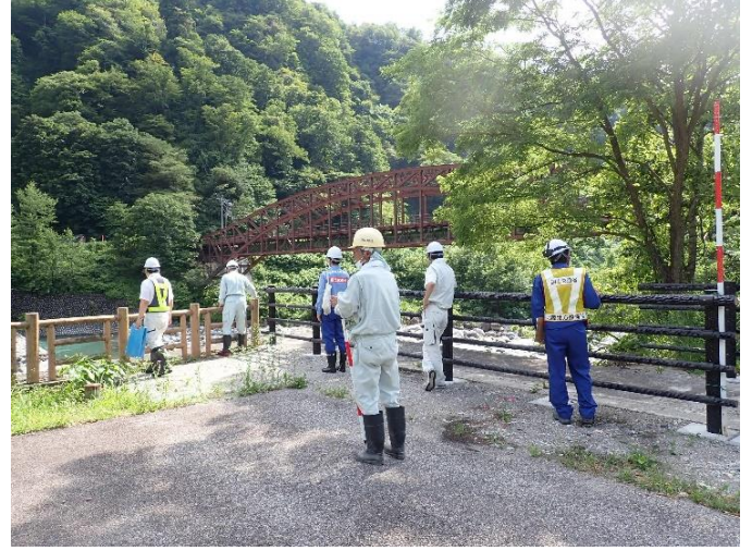
安全利用点検を行う参加者 (常願寺川水辺の楽校)