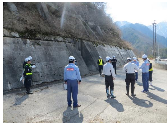
令和6年安全利用点検状況