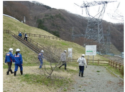
令和6年度の点検状況 （大川ダム管内若郷湖東公園）