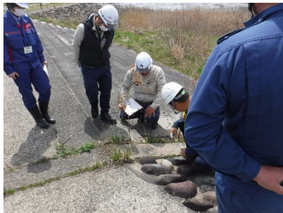
令和6年度の点検状況 （湯川村佐野目地区河川防災ステーション（道の駅あいづ））