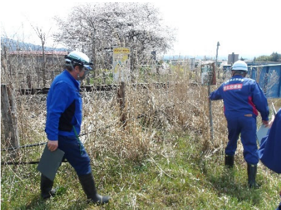
令和6年度の点検状況 （喜多方市日橋川緑地公園）