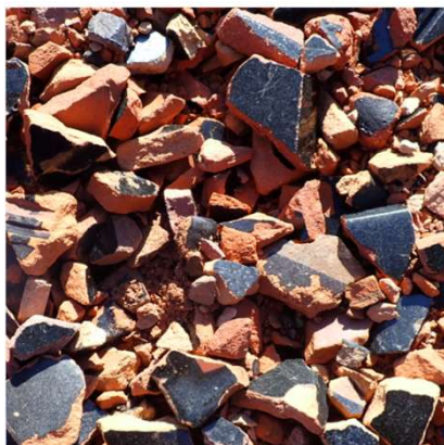
瓦チップ（53mm以下となるようチップ化）