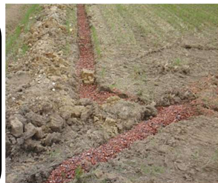
施工イメージ（暗渠）