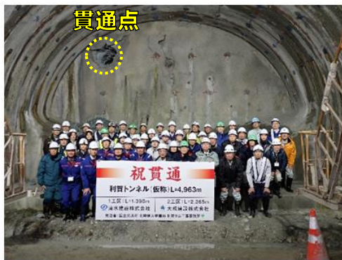
工事関係者で記念撮影