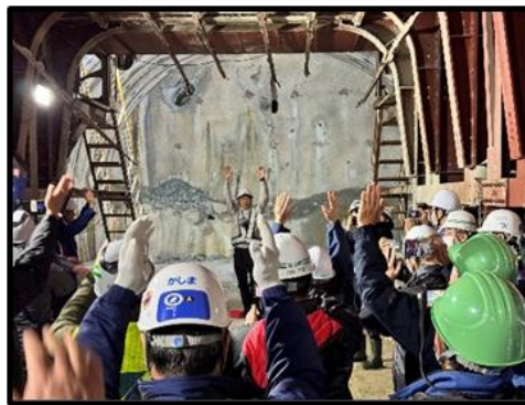
工事関係者で万歳三唱