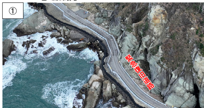
ツバ崎区間待避所