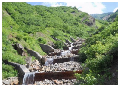
今も現役で活躍する甚之助谷砂防堰堤群