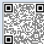
白山砂防 ホームページ