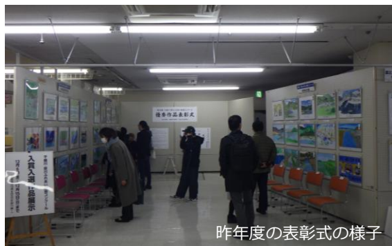
昨年度の表彰式の様子