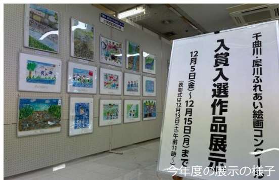
今年度の展示の様子