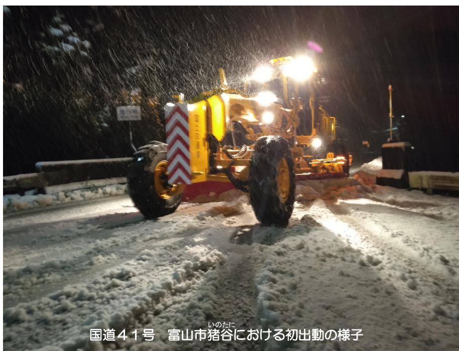
国道41号 富山市猪谷における初出動の様子