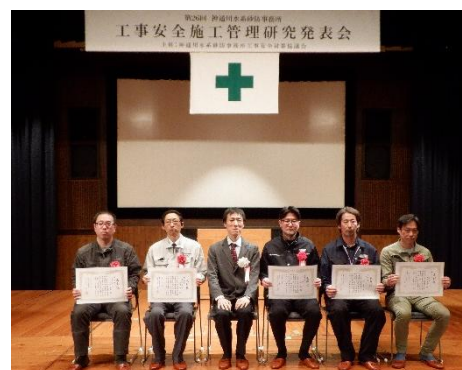
令和6年度開催時写真