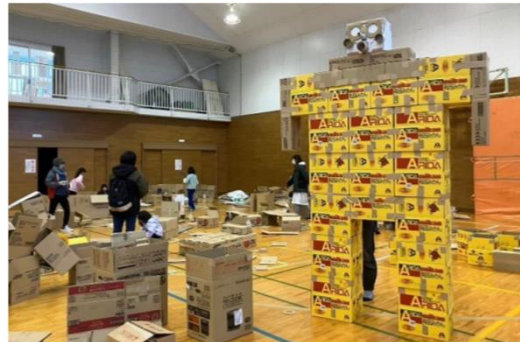
疑似避難所体験 段ボール秘密基地

取材を希望される方は、「別紙1」に必要事項を記入の上、メール又はFAXにて2月2日(月)15:00までにお申し込みをお願いします。