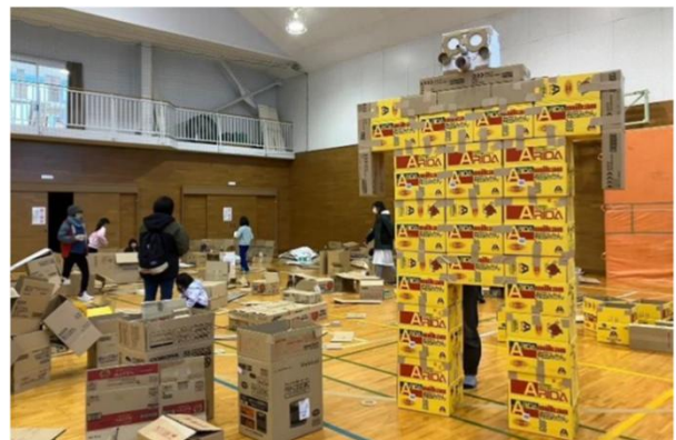
疑似避難所体験 段ボール秘密基地