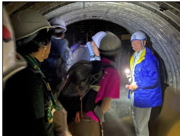
白山砂防現場見学