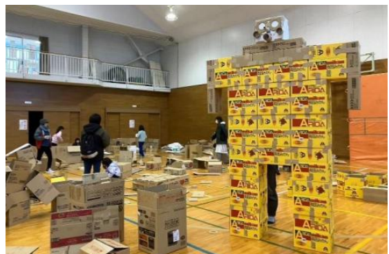
疑似避難所体験 段ボール秘密基地