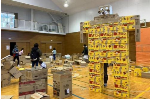
疑似避難所体験 段ボール秘密基地

取材を希望される方は、「別紙1」に必要事項を記入の上、メール又はFAXにて1月21日(水)15:00までにお申し込みをお願いします。