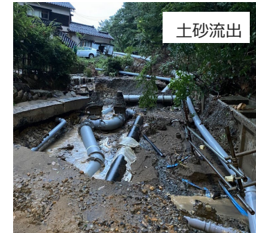
<輪島市 仮設送水管と付近の道路の被害状況>