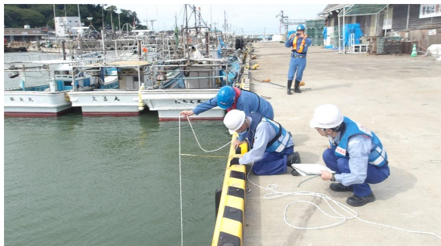
港湾空港班 (輪島市)