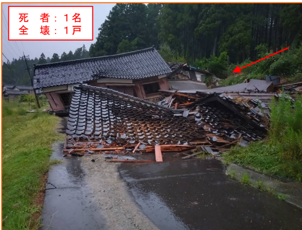
9/23 わじましまちのまちなみときくに 石川県輪島市町野町南時国