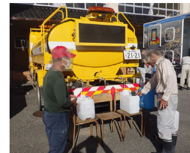
<珠州市 三崎中学校>