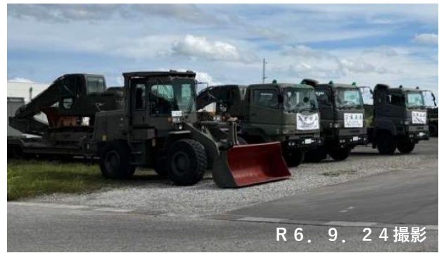
消防車両・自衛隊車両の使用状況