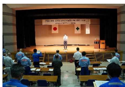
令和5年度大会の様子（写真左：開会挨拶、写真中央：講話、写真右：安全宣言唱和）