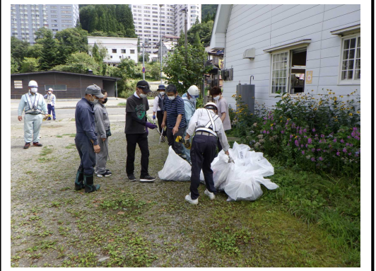
◀令和4年度の様子（令和5年度は猛暑により中止）

※1）国土交通省では毎年8月を「道路ふれあい月間」として、道路を利用する方々に、道路とふれあい、道路の役割や重要性を改めて認識していただくため、道路の愛護活動や道路の正しい利用の啓発活動等を特に推進することとしています。