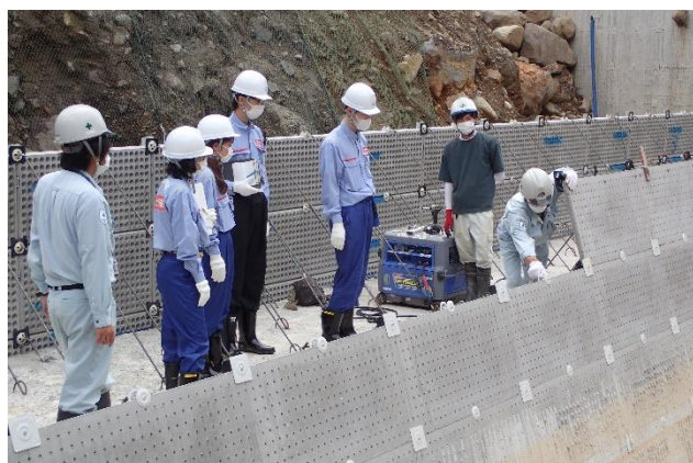
砂防堰堤工事現場見学