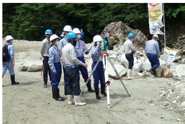
測量機器現場実習