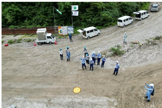
ドローン操作体験