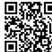
金沢河川国道事務所HP