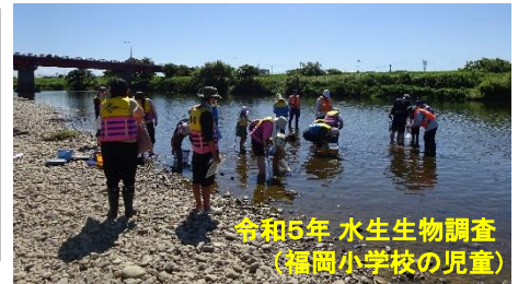
令和5年 水生生物調査 (福岡小学校の児童)