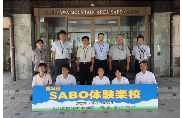
開校式後の記念撮影