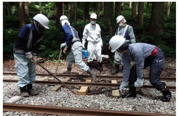
軌道(トロッコ)枕木交換