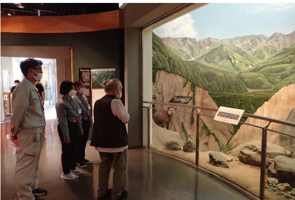
立山カルデラ砂防博物館見学